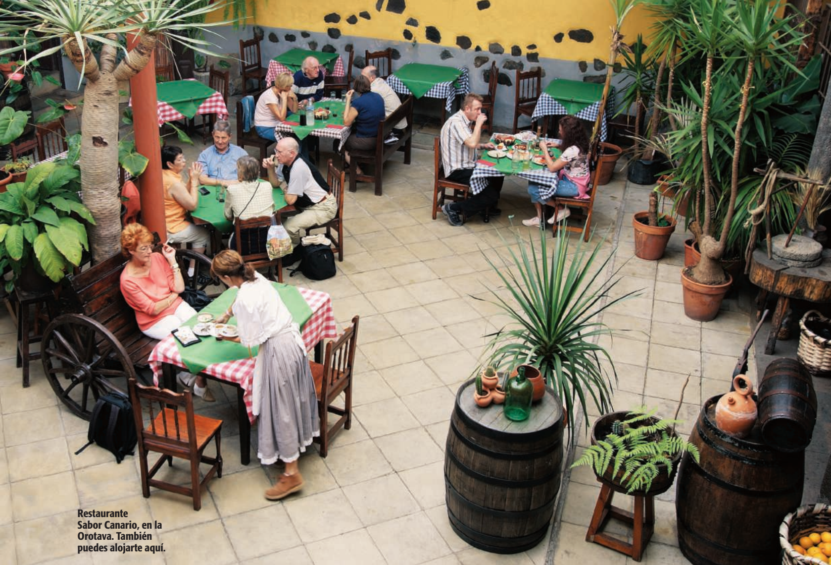
Restaurante Sabor Canario, en la Orotava. También puedes alojarte aquí.