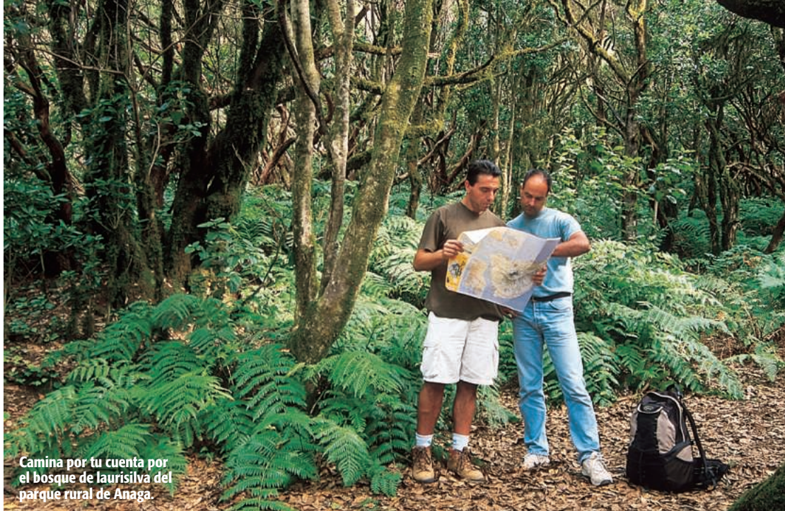
Camina por tu cuenta por el bosque de laurisilva del parque rural de Anaga.

Un vuelo a Tenerife con Spanair (☎ 902 131 415) en primavera te puede salir por unos 150 € ida y vuelta, aunque conviene que eches un vistazo a su página web ( www.spanair.com ) para estar al tanto de las posibles ofertas. En cuanto al vehículo, lo mejor es que tengas la reserva hecha ya desde la Península. En Niza Cars ( www.nizacars.com , ☎ 902 995 950) siempre tienen buenos precios (6 días, un Renault Clío, desde 170 €). Recuerda que la gasolina es más barata.