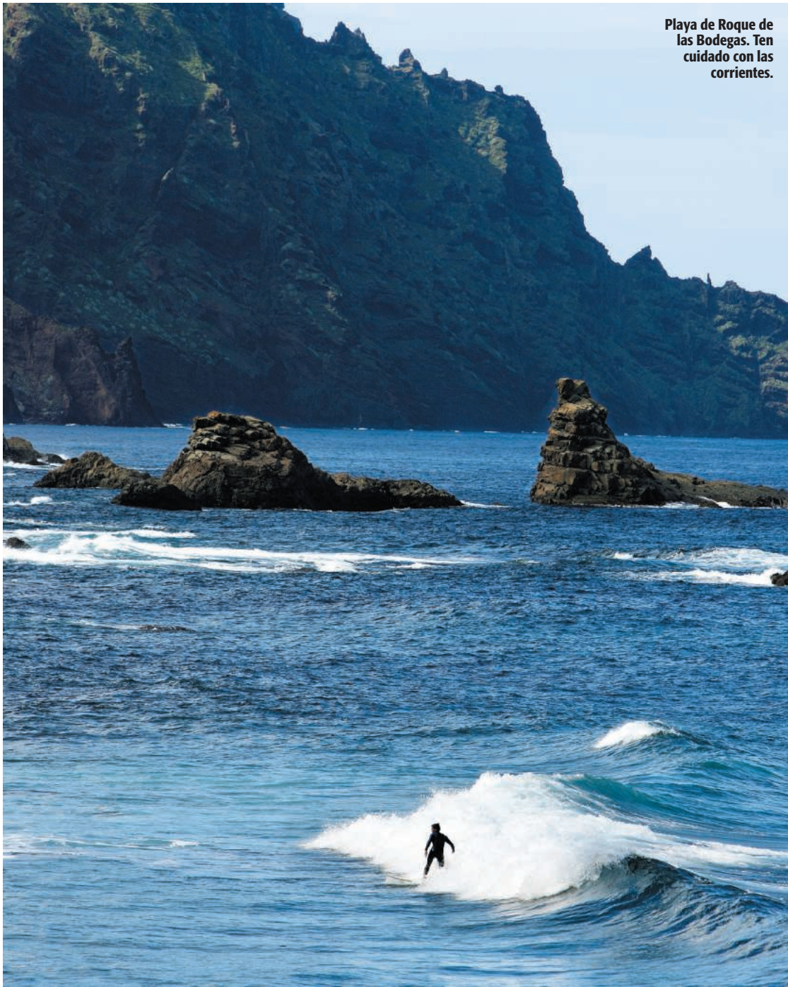
Playa de Roque de las Bodegas. Ten cuidado con las corrientes.

rada Patrimonio de la Humanidad, conserva todo el aire señorial de su noble pasado; fue el primer asentamiento de los conquistadores en la isla. Si decides visitarla de noche, tendrás que perderte por su Cuadrilátero , la zona de marcha preferida por los universitarios. Si la visitas de día, pasea por sus calles con calma. El itinerario debe comenzar por la plaza del Adelantado y seguir por la ermita de San Cristóbal , el Ayuntamiento , el Casino , el Museo de Historia de Tenerife... Desde La Laguna puedes seguir dos rutas: una que te llevará al faro de la Punta del Hidalgo , con abundantes calas y acantilados, y otra hacia el caserío y monte de Las Mercedes : te sorprenderá su paisaje verde. Si sigues este camino te resultará muy fácil adentrarte en el Parque Rural de Anaga , una de las zonas más agrestes de Tenerife. El grupo Aguamonte Tours (☎ 922 178 780) realiza excursiones por esta zona. Pero nosotros te proponemos una ruta sencilla que comienza, pasado el monte Las Mercedes, en el mirador de Jardina , un balcón sobre la vega lagunera que sobresale entre brezales. Mientras escuchas la melodía de los pájaros canarios alcanzarás el Mirador de la Cruz del Carmen , una romántica pérgola en pleno bosque de laurisilva.