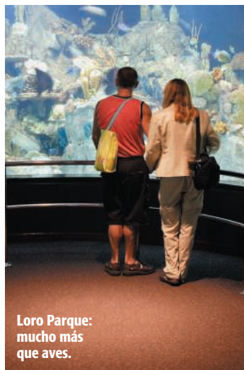
Loro Parque: mucho más que aves.

Desde la Villa de Arriba , en La Orotava, comienza una de las excursiones más espectaculares que podrás realizar en toda la isla.