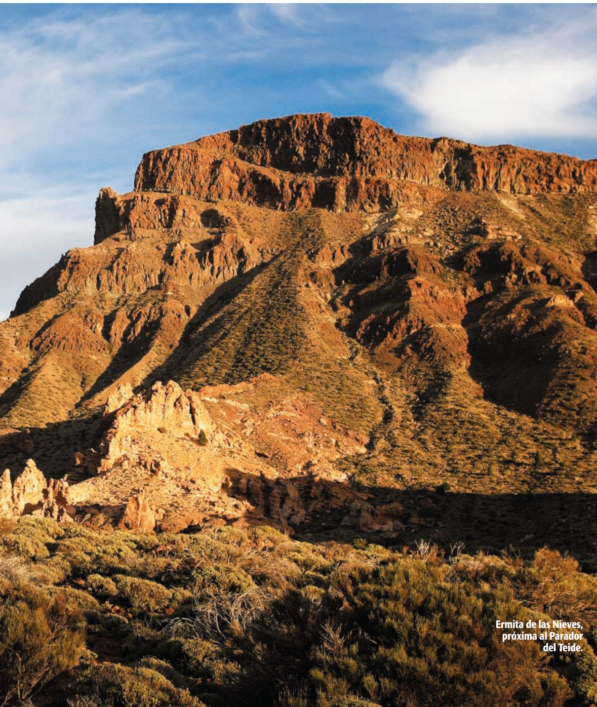
Ermita de las Nieves, próxima al Parador del Teide.

Visitantes. El más fácil de todos es el Sendero de los Roques de García , de 3,5 kilómetros. Empezarás y terminarás en el mirador de la Ruleta , desde donde se contempla una preciosa panorámica del Teide, con los roques justo al lado. Para reponerte del esfuerzo siempre puedes tomar un zumo o algún reconstituyente en la cafetería acristalada del Parador (Las Cañadas del Teide, s/n. ☎ 922 386 415). En cualquier caso, si quieres ponerte en manos de profesionales puedes contactar con el grupo Patea tus montes (☎ 922 335 903) o con Gaiatours (☎ 922 355 272) que organizan rutas senderistas y turismo activo en la zona.