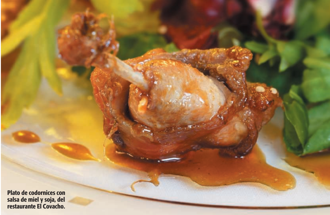
Plato de codornices con salsa de miel y soja, del restaurante El Covacho.