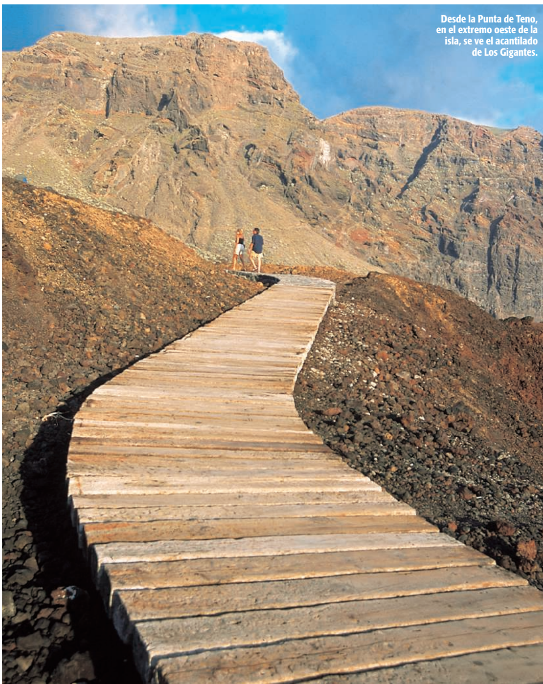
Desde la Punta de Teno, en el extremo oeste de la isla, se ve el acantilado de Los Gigantes.

El crecimiento urbano de Santa Cruz de Tenerife ha permitido que la ciudad haya quedado prácticamente unida al municipio de La Laguna , cuya capital, San Cristóbal de la Laguna , decla-