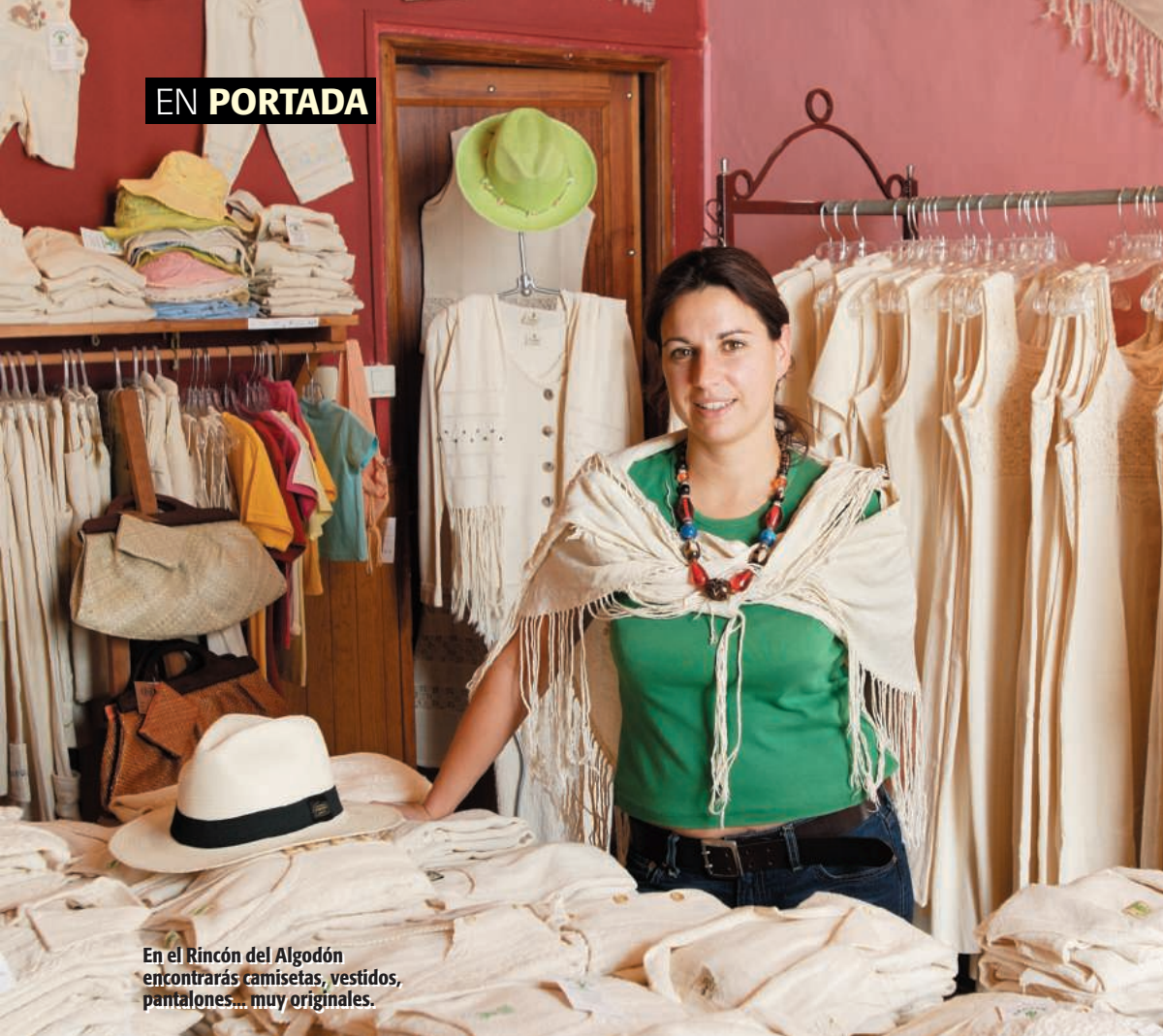
En el Rincón del Algodón encontrarás camisetas, vestidos, pantalones... muy originales.