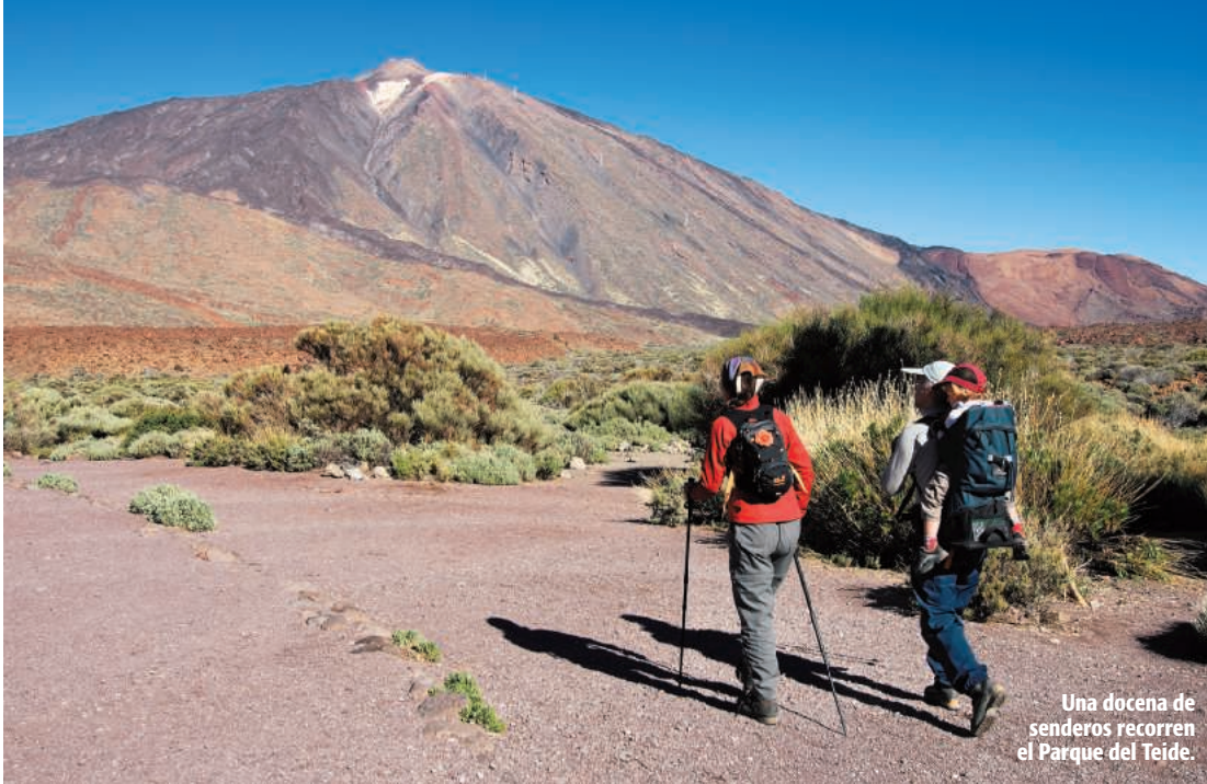
Una docena de senderos recorren el Parque del Teide.